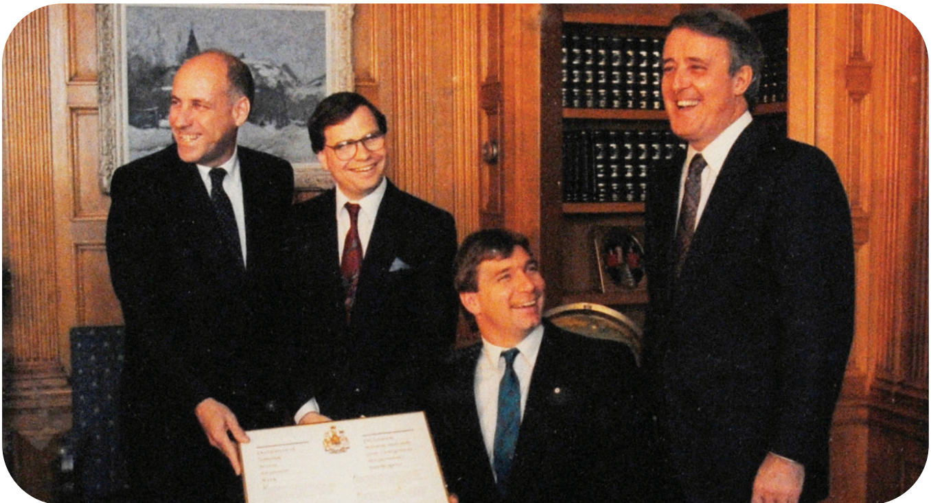
La Déclaration de la Semaine nationale pour l'intégration des personnes handicapées signée par le premier ministre Brian Mulroney, juin 1989.

M. Hansen a approché le gouvernement fédéral en 1987 pour lui faire part de son idée. Au cours de l'année qui a suivi, M. Hansen et la Fondation Rick Hansen se sont associés au ministère du Secrétariat d'État pour offrir un leadership stratégique dans le but de rassembler 23 organismes nationaux qui travailleraient avec les municipalités, les entreprises, les groupes de bénévoles et les collectivités locales de partout dans le Canada. On a ainsi formé un groupe de travail pour représenter les partenaires et pour aider les groupes communautaires du pays à organiser des activités. M. Hansen et la Fondation Rick Hansen ont aidé à trouver des partenaires commerciaux pour apporter soutien à l'événement et pour faire la promotion de la semaine grâce à des annonces et des communications publiques.